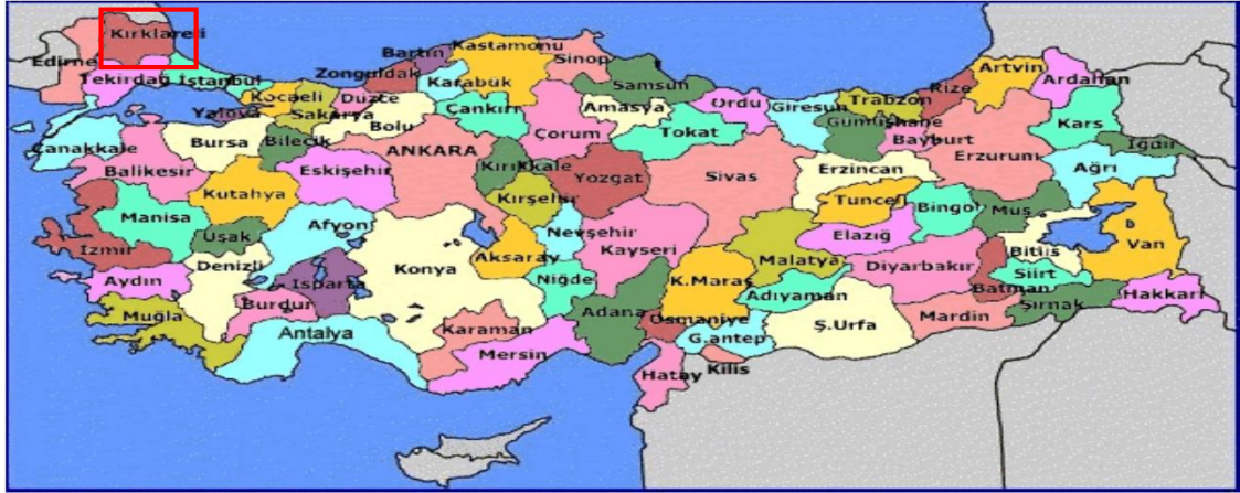
Harita 1 - Kırklareli'nin Konumu

Kırklareli İli, Marmara Bölgesinin Istranca (Yıldız) Dağları ve Ergene Ovası bölümleri üzerinde yer alan, kuzeyinde Bulgaristan, kuzey doğusunda Karadeniz, güney doğusunda İstanbul, güneyinde Tekirdağ ve batısında Edirne ile çevrilmiştir. Yüzölçümü 6.550 kilometrekaredir. Bulgaristan'a 180 kilometre kara sınırı, Karadenize 60 kilometre deniz kıyısı bulunmaktadır. Denizden 203 metre yükseklikte, kuzey ve doğusu dağlık ve ormanlık diğer bölümü genelde düzlük arazidir. Bölgede genellikle kara iklimi hâkimdir. Kışları sert ve yağışlı, yazları sıcak ve kurak geçer. Başlıca akarsuları Ergene Nehri ve Rezve Deresidir. Bitki örtüsü olarak ormanlık ve step özelliği göstermektedir.