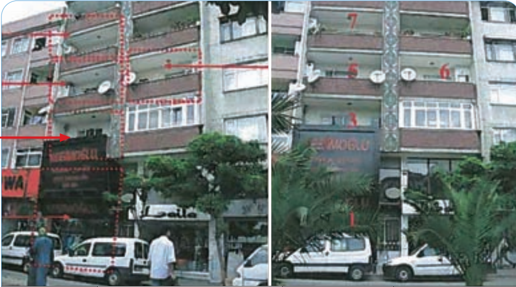
3 No'lu Bağ. Bölüm

İstanbul İli, Zeytinburnu İlçesi, Telsiz Mah., 389/1 pafta, 2306 ada, 17 parselde kayıtlı, 299 m 2 miktarlı 16/200 arsa paylı, 1. kat, 3 bağımsız bölüm no'lu daire.