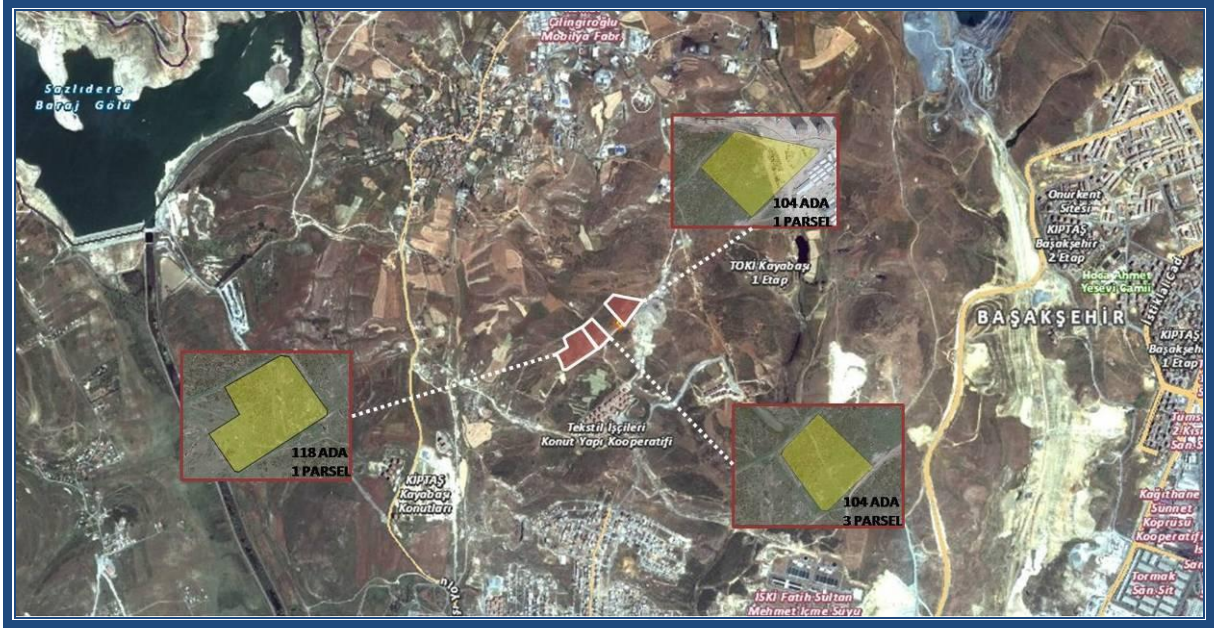
(EK: 1: Gayrimenkullere Ait Fotoğraflar)

Söz konusu gayrimenkuller, İstanbul İli, Başakşehir İlçesi, Güvercintepe Mahallesi'nde yer almakta olup, yakın çevresinde TOKİ Kayabaşı 1. Etap Evleri, Rumeliler Sitesi, Tekstil İşçileri Kooperatifi, KİPTAŞ Kayabaşı Konutları, İSKİ Fatih Sultan Mehmet İçme Suyu Tasfiye Merkezi ve birçok konut yer almaktadır.