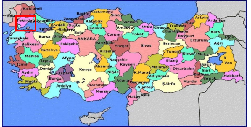
Harita 1 - Tekirdağ'ın Konumu

Tekirdağ'ın iklimi, Akdeniz iklimi ve kara ikliminin bir karışımıdır. Sahil yöresinde Marmara Denizi'nin etkisiyle nemli bir bölgedir.