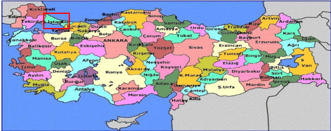
Harita 1 - İstanbul'un Konumu

İstanbul, Türkiye'nin en büyük kenti olup, 13 milyon kişiyi aşan nüfusu ile dünyanın da sayılı kentlerinden biri haline gelmiştir. Batı ile Doğu arasında köprü olma özelliği ile yerli ve yabancı sermaye için, bölgelerarası ilişki kurma ve bölgelere açılma yönünden önemli bir merkezdir. İstanbul Boğazı, Karadeniz'i, Marmara Denizi'yle birleştirirken; Asya Kıtası'yla Avrupa Kıtası'nı birbirinden ayırmakta ve İstanbul kentini de ikiye bölmektedir.