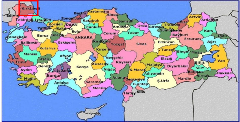
Harita 1 - Kırklareli'nin Konumu

Kırklareli İli, Marmara Bölgesinin Istranca (Yıldız) Dağları ve Ergene Ovası bölümleri üzerinde yer alan, kuzeyinde Bulgaristan, kuzey doğusunda Karadeniz, güney doğusunda İstanbul, güneyinde Tekirdağ ve batısında Edirne ile çevrilmiştir. Yüzölçümü 6.550 kilometrekaredir. Bulgaristan'a 180 kilometre kara sınırı, Karadenize 60 kilometre deniz kıyısı bulunmaktadır. Denizden 203 metre yükseklikte, kuzey ve doğusu dağlık ve ormanlık diğer bölümü genelde düzlük arazidir. Bölgede genellikle kara iklimi hâkimdir. Kışları sert ve yağışlı, yazları sıcak ve kurak geçer. Başlıca akarsuları Ergene Nehri ve Rezve Deresidir. Bitki örtüsü olarak ormanlık ve step özelliği göstermektedir.