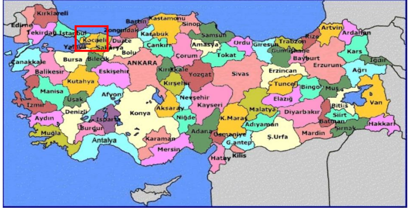
Harita 1 - Kocaeli'nin Konumu

Kocaeli bir sanayi kenti olarak GSYİH'nın yüzde 69.9'unun sanayi sektöründe yaratıldığı bir bölgedir ve ilde Sanayi Odası'na bağlı yaklaşık bin 300 sanayi kuruluşu faaliyet göstermektedir. Bu sanayi kuruluşları ağırlıklı olarak Gebze, İzmit ve Körfez ilçelerinde toplanmıştır. Ülkemizin en büyük 100 sanayi kuruluşunun 18'i Kocaeli'nde bulunmaktadır. TÜPRAŞ, Hyundai Assan, Ford Otosan, Honda, Anadolu Isuzu, Pirelli, Goodyear, Pakmaya, Aygaz, Milangaz, Petrol Ofisi, Kordsa, Çelikkord, Nuh Çimento, Marshall, Polisan, ÇBS, Mannesman Boru gibi önemli fabrikalar bu kentte faaliyet göstermektedir.